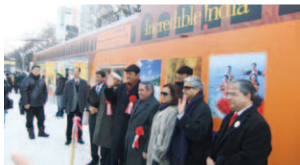
雪まつり会場にて

国際プラザは、今回のイベントに当初から関わってきましたが、観光及びMICE市場としても、両地域の連携協力を強化し、さらなる発展を目指す一翼を担いたいと考えています。