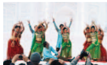
舞踊団による演舞

2012年は、日本とインドの国交樹立60周年の記念の年であり、国内各地でインドとの交流事業が開催されます。インド政府は、そのキックオフイベントとして、去る2月6日(火)から開催された“第63回さっぽろ雪まつり”において、大通7丁目会場(HBC広場)にタージ・マハールの大雪像やインド関連の店等、「インド広場」を設置しました。