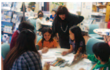
サロンでお絵描き！

日常的にサロンに立ち寄ってくださる方が少しでも増えると思っていると嬉しく思います。