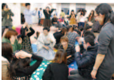
かたるた大会は大人気

町内会・ボランティアの皆さんの交流を楽しむと同時に、学校を超えた留学生同士のつながりも生まれました。