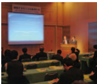
モンゴルセミナー 投資局長(左)

3月1日(木)、札幌市内のホテルで、モンゴル経済の現状を紹介するセミナーが開かれ、道内各地から企業経営者ら約30名が参加しました。このセミナーは、冬の見本市への参加を契機にモンゴルとのつながりを深めていこうと出展委員会が企画したものです。