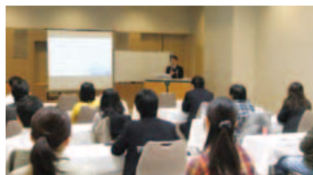
MICE アカデミー【入門セミナー】の様子

2011年9月から11月にかけて実施したMICEアカデミーでは、MICEに関わる人材育成を目的として、業界関係者等向けの「企業セミナー」、未就業の初心者向けの「入門セミナー」および中級者向けの「スキルアップセミナー」を開催。施設見学や模擬プレゼンテーションなど実践的な内容も多く、参加の方々から好評を得ました。次年度以降は、さらにもう1部門を増え、ますます充実した内容が期待されています。 また、コンベンション参加者向けコンテンツ整備として、BRAWプロジェクト事業を実施しました。北海道の委託事業として、札幌商工会議所も含めた3者のコンソーシアムにより行ったこの事業では、MICEコンテンツとして、ランニング・ウォーキング・自転車(Bike, Run, and Walk=BRAW)向けの二セコ・札幌両地区の日本語版と英語版の2種類の地図を制作。WEB上でも、その10倍以上の多彩なコースと詳細な情報を提供する斬新な取組みとなっています。また、3月には網走、二セコ、札幌の道内3カ所での北海道のスポート観光とMICE振興」と題するセミナーも実施し、道内でも関心が高まる同分野の関係者が数多く出席しました。