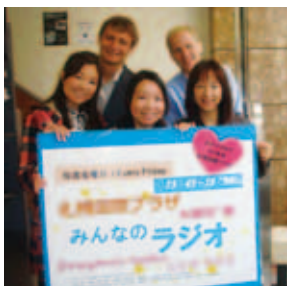
週替わりで5カ国の交流員が出演

「みんなのラジオ」は、今年で4年間の実証実験を終了します。災害時に情報弱者となる可能性のある外国人への情報提供について、国際プラザは今後もさらに効果的な方法を探っていきます。