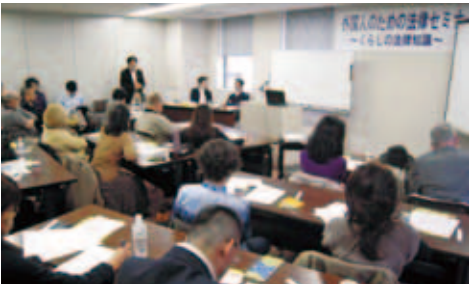
ユーモアを交えた、わかりやすい解説

国際プラザでは、外国人住民が安心して生活できるための取組みを、今後も続けていきます。