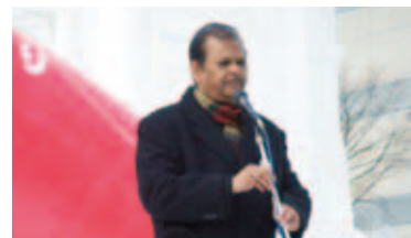
インド共和国観光大臣によるスピーチ

インド共和国観光大臣スポドゥ・カント・サハイ閣下が初めて開会式に参加され、ユネスコ世界遺産であるタージマハールの大雪像をバックに、これまでの両国の相互理解への感謝と、今後益々の親交の約束をされるなど、大勢の市民や観光客に大きなメッセージを熱く伝えました。