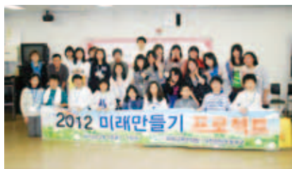
子ども会との交流会