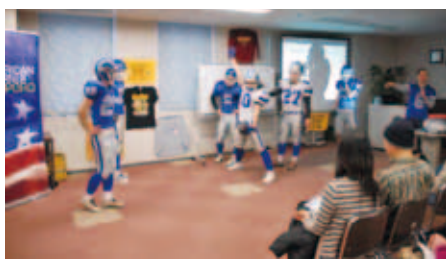
ゲームの実演をする選手のみなさん

その場で実演してくれ、ぶつかり合う迫力に参加者は圧倒されていた様子でした。参加者たちは選手たちとの交流も楽しみ、イベントは盛況のうちに終了しました。