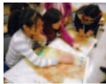
避難所の場所を確認！

札幌市民防災センターにて中国からの留学生が地震や消火訓練等を体験しました。体験訓練後には、館長より災害・防災についてお話を伺いました。地震が発生したとき、何をすれば良いのか、避難所とはどのようなところか。参加者は真剣に耳を傾けました。「防災マップ」を使い、自宅最寄りの避難所を確認し、「大学が避難場所に指定されているので、災害時は大学へ向かいます」と、留学生の安心にもつながりました。