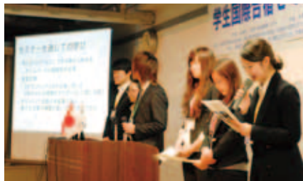
活動報告会の様子