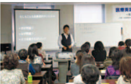
ユーモアをまじえた説明

参加された方々からは、今後の開催予定を尋ねる方も多く、医療通訳・医療英語への関心の高さがうかがえました。