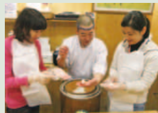
寿司握りにチャレンジ！