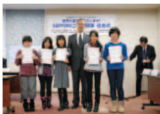
任命証を胸に記念撮影

札幌国際プラザの財団法人化20周年を記念して、全国初の試みとして開催した「SAPPROこども領事」には、市内の小学校12校より、5、6年生48名が参加。去る12月10日(土)、市内9つの総領事館、領事館、通商事務所、名誉領事館の代表から、各国の「こども領事」に任命されました。