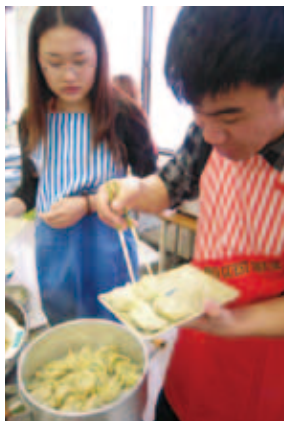
各国自慢の料理に挑戦

都市である中国瀋陽と韓国大田からの学生17名と、留学生を含む札幌圏在住の学生13名、計30名の大学生が、2月11日(土)から22日(水)までの12日間にわたって、「行動しよう！学生によるボランティア活動を通したまちづくり」のテーマのもと、ボランティア活動に関する講義や「小樽雪あかりの路」をはじめとした活動体験、市民ボランティア活動団体へのヒアリング、震災ボランティアに取組む学生団体との意見交換、日中韓混合チームによるグループディスカッションなどをしながら体系的に学びました。