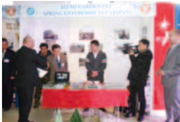
現地テレビ局の取材の様子

札幌・北海道からの出展企業では、山謙工業(札幌)、いずみガーデン(旭川)、旭栄工務(旭川)、ケイセイマサキ建設(新冠)の建設関連4社と札幌市防災協会がブースを設け、高断熱住宅や施工技術を