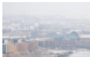
ウランバートル市 郊外

初めにウランバートル市のテムルチュルン投資局長が講演。集合住宅や道路・橋梁等のインフラ整備需要が高まっていることをアピールし、日本の品質の高さや技術を学びたいと、道内企業のモンゴル進出への期待を述べました。