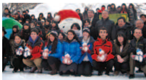
札幌の高校生と雪像を共同作成

期間中は平岸高校の生徒と雪まつり大通会場で雪像を共同作成したり、レッツトーク(2月7日(火))やワールドカフェ(2月11日(土))で多くの札幌市民と直接会話する